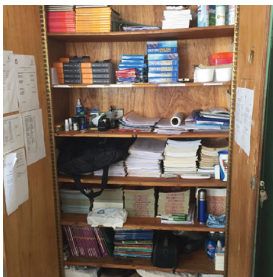
Foto: Klaslokaal jongvolwassen en lesmateriaal

De volwassenen kunnen alleen een GED-programma of computerles volgen. Een aantal respondenten geeft aan dat men voorheen een breder aanbod aan opleidingen had voor volwassenen.