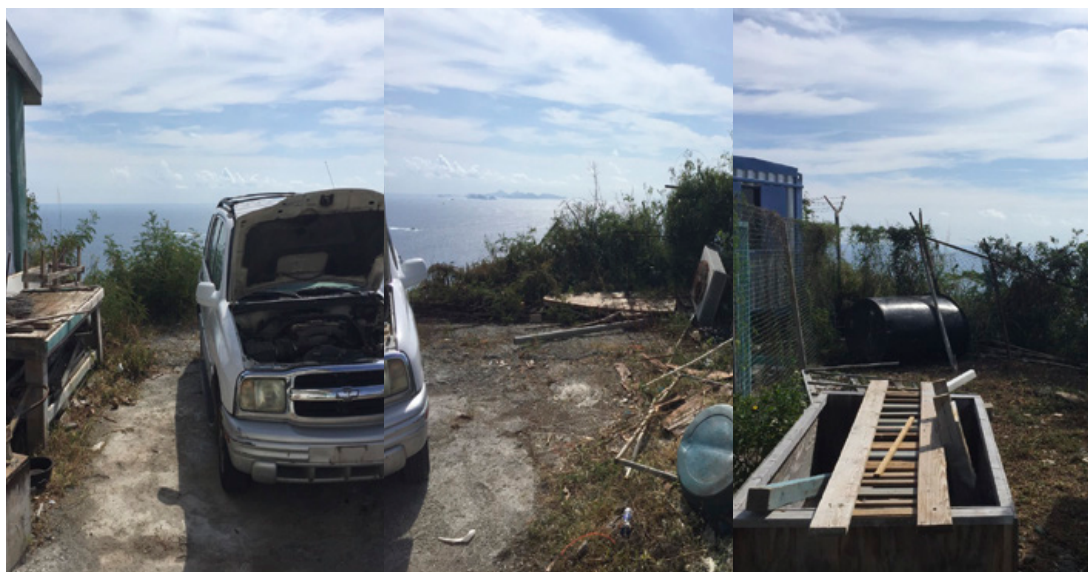
Foto: Deel van de vervallen omheining naast de werkplaats

Tijdens de rondleiding van de inspecteurs bij de werkplaatsen viel hen het volgende op en waarmee volgens de inspecteurs niet kan worden gewacht tot aan de volgende inspectie omtrent de interne veiligheid en maatschappijbeveiliging. Zeer verontrustend is het grote gat in de vervallen omheining van de gevangenis, welke zich pal naast de werkplaats bevindt en aldus directe toegang tot vrijheid biedt. Hierdoor worden niet alleen de ontsnappingsmogelijkheden zowel gedurende de arbeid als daarbuiten vergroot, maar ook de kans dat contrabande hun weg kunnen vinden naar de gevangenis.