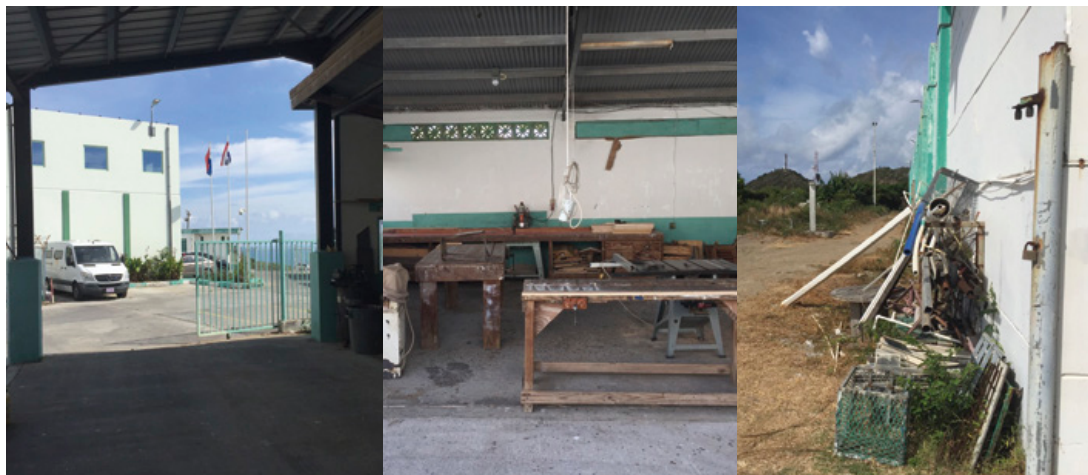
Foto: Werkplaats en voormalige tuin

In de gevangenis is er aanbod van arbeid, maar het is niet voldoende om iedereen van werk te voorzien. Ook is niet iedereen geschikt om te werken. In de interviews wordt aangegeven dat men officieel gemiddeld 6 uur per dag kan werken in de keuken, de werkplaats, het naaiatelier, de huishoudelijke dienst en de bibliotheek. Ook is er een gedetineerdencommissie met een tweetal leden die zijn vrijgesteld van arbeidsplicht. Voorheen kon men ook handenarbeid doen en was er een tuin om in te werken.